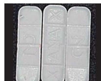
Xanax falsificado mezclado con fentanilo