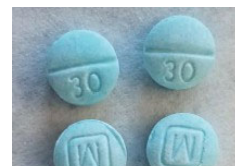
Oxicodona falsificada mezclada con fentanilo